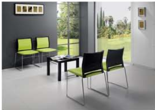
◀ Silla recepción. DESDE 105 €

Mostradores de diferentes estilos y acabados logran personalizar cada ambiente con una máxima adaptabilidad al espacio de la oficina. Sofás, butacas y otros accesorios responden a todos los requisitos necesarios para hacer de la espera un momento agradable.