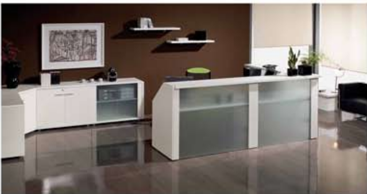
◀ Módulo mostrador recto de 130x65 cm. Acabado bilaminado, color según muestrario. Panel cristal opcional. DESDE 302 €